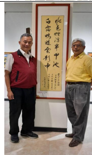
參訪 楊大畫家藝展